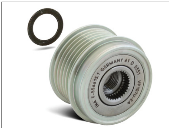
Bild 2: Beim Einbau des Generatorfreilaufes an einem Bosch Generator muß die beiliegende Distanzscheibe mit der Dicke 1,4 mm verwendet werden!

Durch starke dynamische Bewegungen des Keilrippenriemens kann es bei Fahrzeugen mit starrer Generatorriemenscheibe zu starker Geräuschbildung kommen.